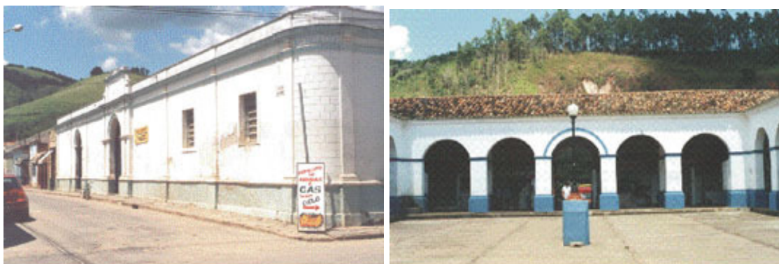
Fotos 1 e 2 – Fachada externa e pátio interno do Mercado Municipal em 2001