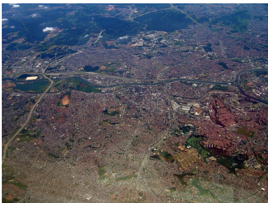
Figura 2 – Foto aérea da mancha conurbada dos municípios de São Paulo, Osasco, Carapicuíba e Barueri. Março/2008

Entender os espaços livres como sistema no contexto do município já representa uma significativa evolução, embora ainda exista um longo caminho a se trilhar em direção a aplicações práticas e efetivas desses conceitos. Mas a complexidade dos fenômenos urbanos extrapola os limites administrativos de cada município. A conurbação 3 e a urbanização dispersa 4 são fatos presentes há mais de trinta anos em vários municípios brasileiros 5 , que evidenciam a necessidade crescente de se entender as questões urbanas em escala metropolitana. Tornam-se cada vez mais frequentes as conexões físicas e funcionais entre cidades, tornando-as parte de um tecido caracterizado por continuidades e fragmentações. (Figura 2).