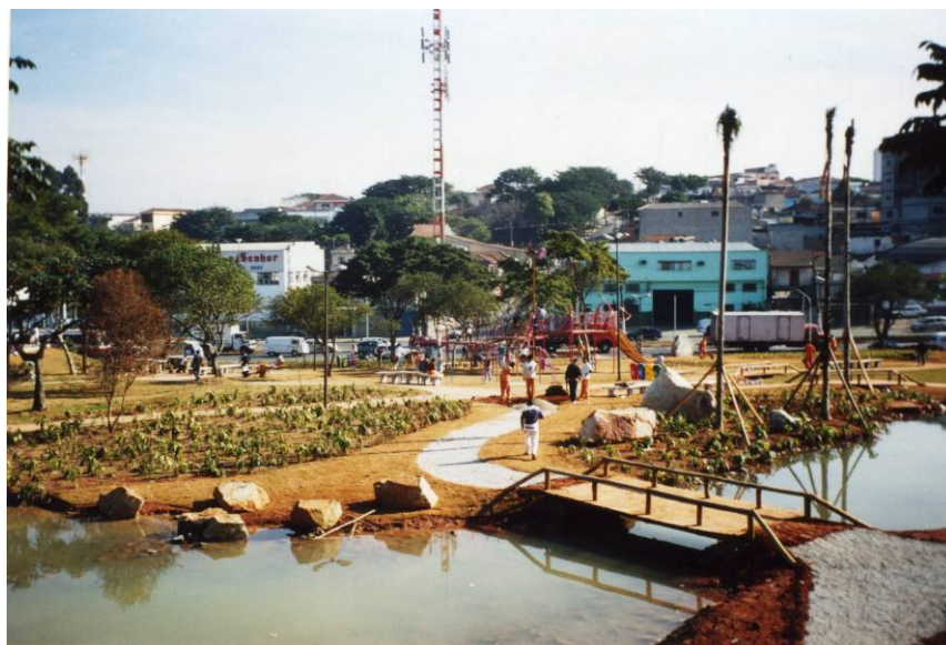
Figura 4 – Praça General Milton Tavares – São Paulo – SP. Agosto/2003

A fragmentação administrativa e a suscetibilidade dos projetos a interesses políticos evidenciam a necessidade da criação de uma entidade que confira conexão e continuidade nas ações sobre espaços livres na RMSP. As ações de qualificação dos espaços livres exigem uma atuação contínua, menos suscetível a flutuações e menos influenciada por interesses individuais.