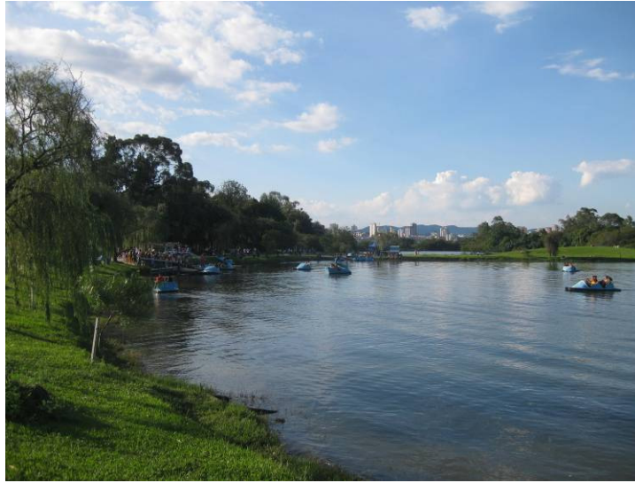
Figura 3 – Parque Ecológico do Tietê. Ao fundo avista-se o município de Guarulhos, que não possui conexão direta com o parque. Março/2010

A fragmentação administrativa ocorre não só nas interações entre municípios, como também dentro de uma mesma esfera do poder público. Tanto na esfera municipal quanto estadual observa-se uma sobreposição de atuações que dificulta o processo de gestão. Tal forma de atuação acaba por gerar descontinuidades administrativas, acarretando em dificuldade para implantação ou mesmo inviabilização de projetos devido a questões burocráticas.